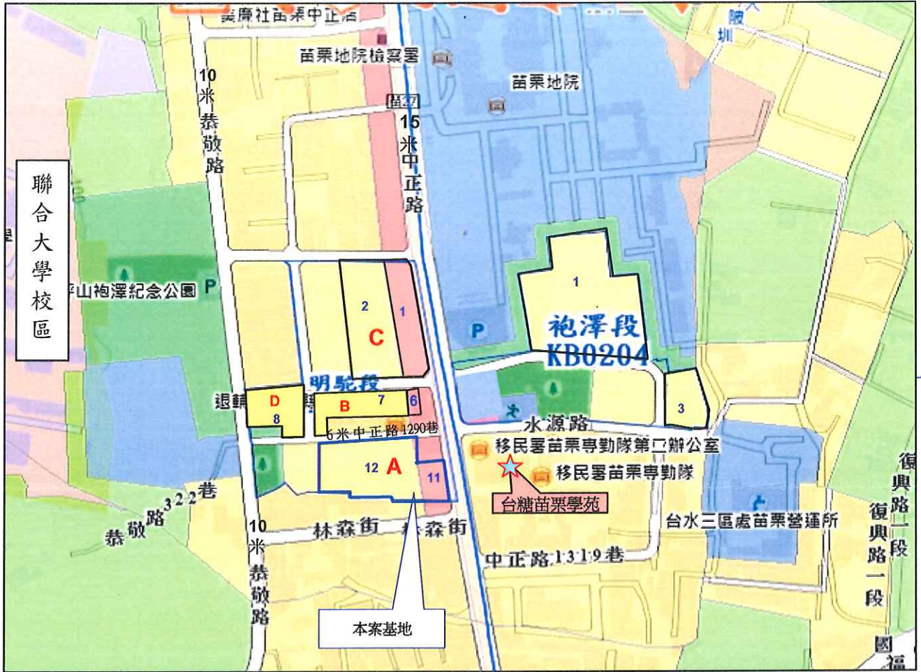
(一)基地位置示意圖